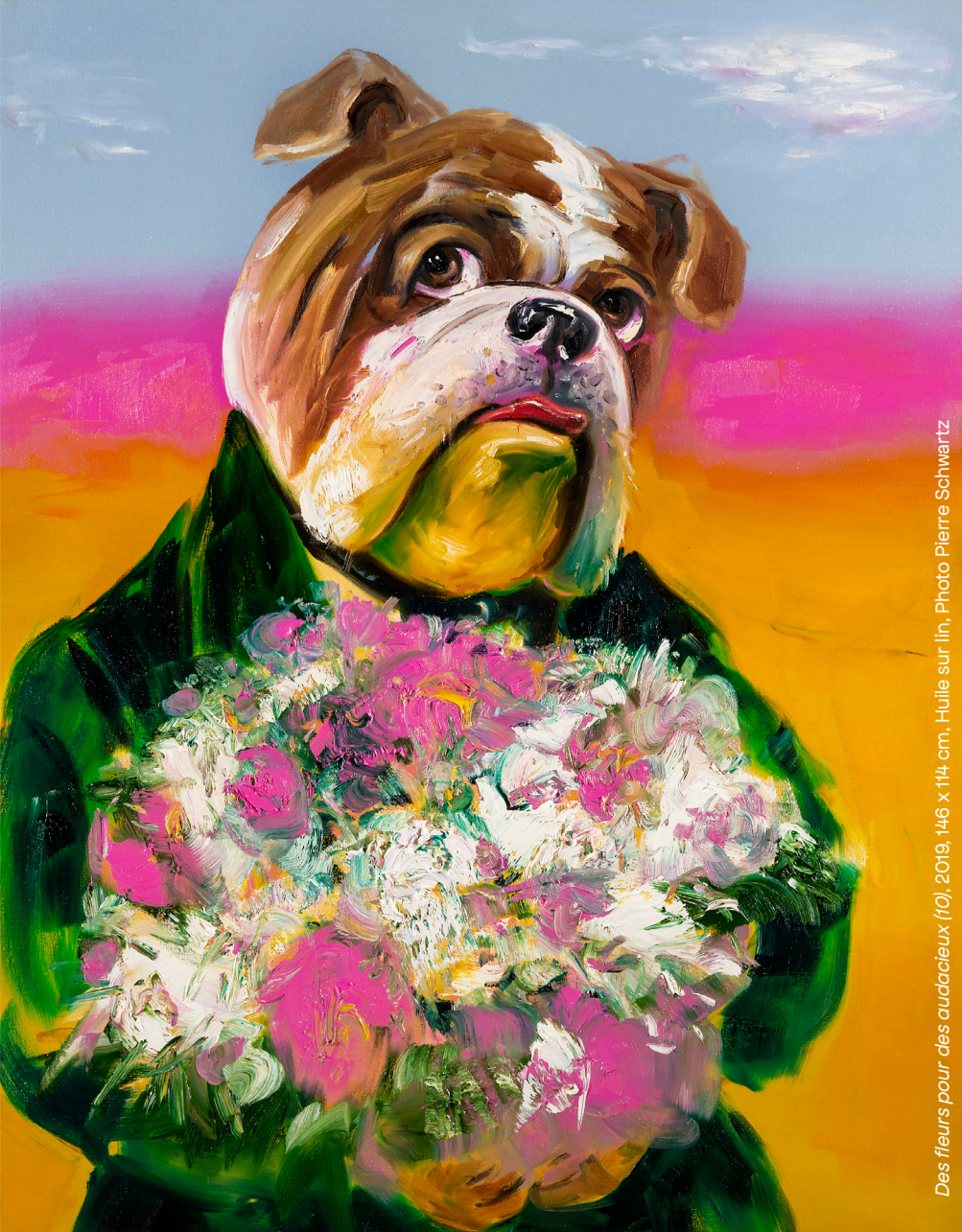
Des fleurs pour des audacieux (10), 2019, 146 x 114 cm, Huile sur lin