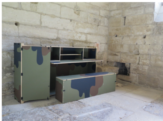
01 Partie de Campagne (Papillon), contreplaqué, peinture, quincaillerie noire mat, 203 x 108 x 35 cm, 2016