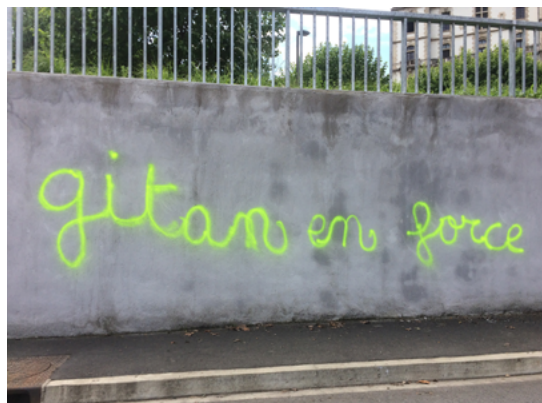
02 Patate de forain, impression dos bleu sur mur peint, dimensions variables, 2021