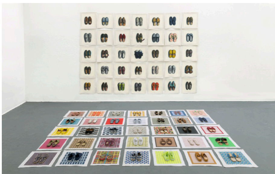
01 LISA MILROY, 2016 Shoes , peinture et installation Au sol : 35 acryliques sur toile 51 x 51 cm chacune 35 paires de chaussures Au mur : 35 huiles sur toile 51 x 51 cm chacune