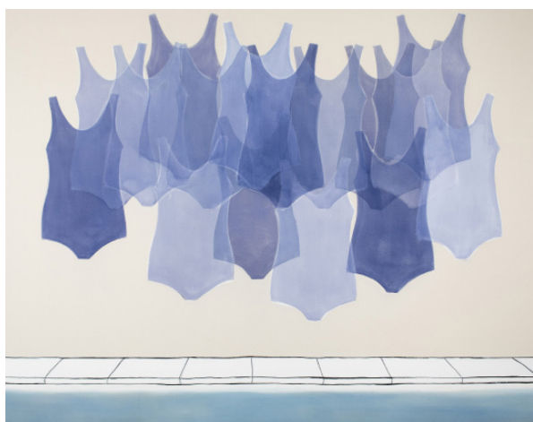
05 LISA MILROY, 2018 Dip , acrylique et huile sur toile 217 x 276 x 5,5 cm