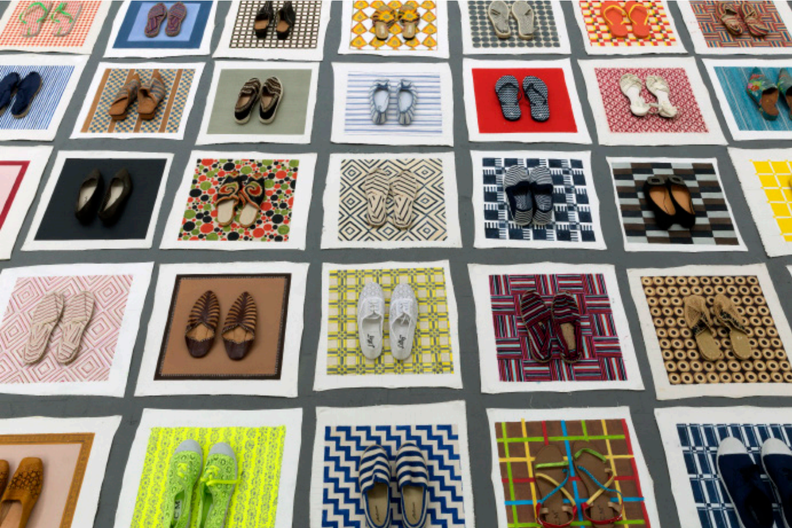
Lisa Milroy, Shoes , 2016 detail