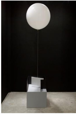
Perrine Leivens – Distance variable 2007 – 2009 – Collection Frac Occitanie Montpellier