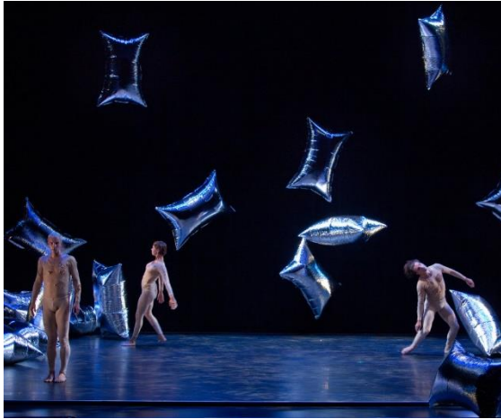
Spectacle de Merce Cunningham Rain Forest – Musique électronique signée David Tudor et les silver pillows d'Andy Warhol