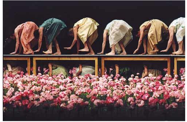
Spectacle de Pina Bausch – Ulli Weiss – 2015 © Théâtre du Châtelet.