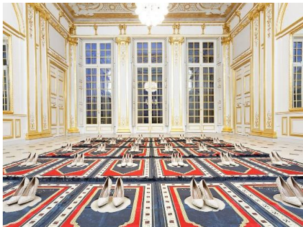
Zoulikha Bouabdellah - Silence (courtesy Galerie Anne de Villepoix, Paris) https://www.telerama.fr/sortir/zoulikha-bouabdellah-une-artiste-face-a-l-autocensure,122295.php