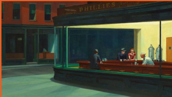
Edward Hopper – Nighthawks - 1942 - Huile sur toile, 84,1 x 152,4 cm – Chicago - The Art Institute of Chicago

https://www.beauxarts.com/grand-format/edward-hopper-en-2-minutes/