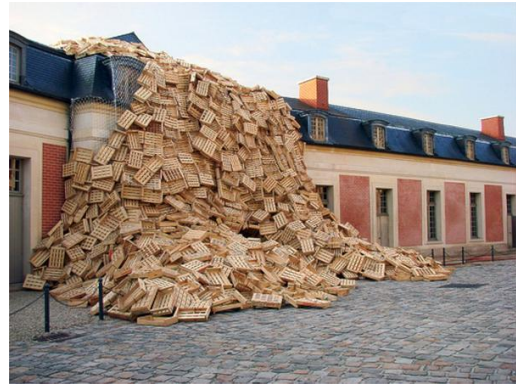
Tadashi Kawamata - Gandamaison - Installation à Versailles – 2008