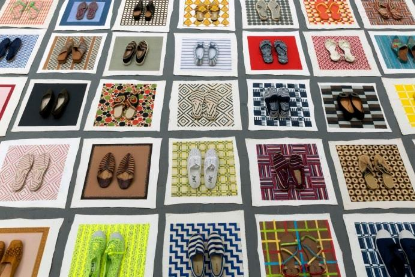
Lisa Milroy, Shoes , 2016 détail