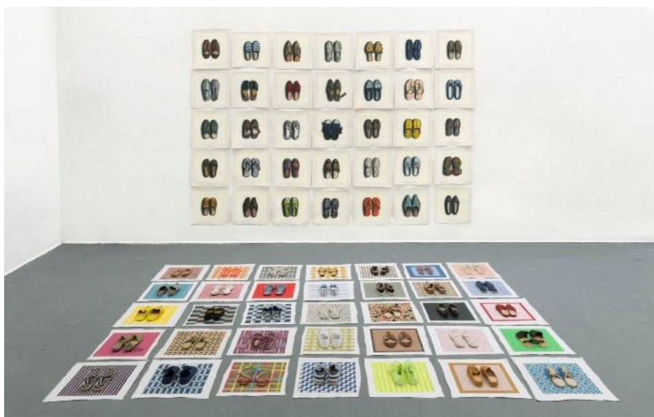
Lisa Milroy – Shoes – 2016