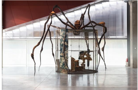
Louise Bourgeois – Spider – 1997