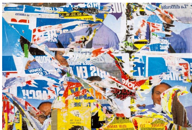
Jacques Villeglé - Boulevard de Ménilmontant, 16 mars 1986 1986 – 107 x 158 cm PO série Politiques – Affiches lacérées marouflées sur toile