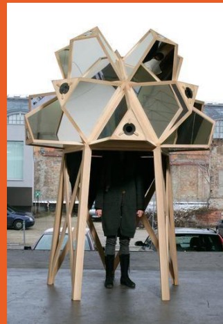
Olafur Eliasson – Dream House – 2007 https://olafureliasson.net/tag/TEL2974/camera-obscura

https://www.beauxarts.com/grand-format/edward-hopper-en-2-minutes/