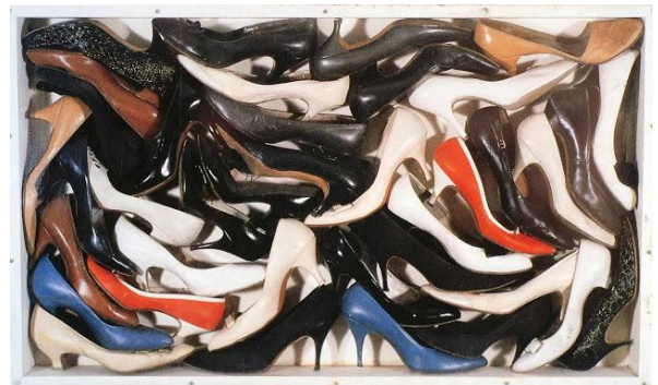
Arman - Madison Avenue - 1962 https://www.armanstudio.com/catalogues/catalogue_accumulation_collection/arman_collection_list.html