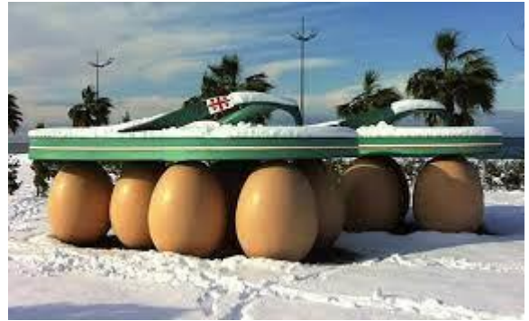
Elisa Fantozzi - Périlleusement vôtre - Sculpture en résine, 5,50m de long, 2,50m de large pour chaque tong, hauteur 1,70m Commande publique pour la Mairie de Batumi, Géorgie - 2011