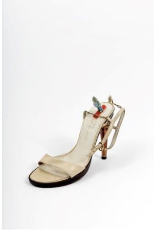
Présence Panchounette - Saint-Moritz 1988 - Collection Frac Occitanie Montpellier