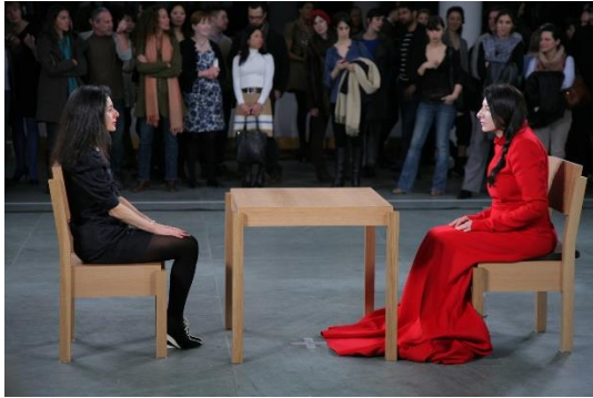
Marina Abramovic – The Artist is Present – 2010

Les œuvres de L. Milroy se prêtent à un travail sur la question du genre. Cette thématique traverse son œuvre. Elle y est présente de manière sensible principalement par la représentation d'un dressing exclusivement féminin.