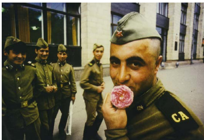
Boris MIKHAILOV Red Series , 1968 – 1995 (Détail) Collection Frac Occitanie Montpellier

L'artiste ukrainien Boris Mikhaïlov est aujourd'hui considéré comme l'un des artistes contemporains les plus influents d'Europe de l'Est. Il développe depuis plus de cinquante ans une œuvre photographique expérimentale autour de sujets sociaux et politiques.