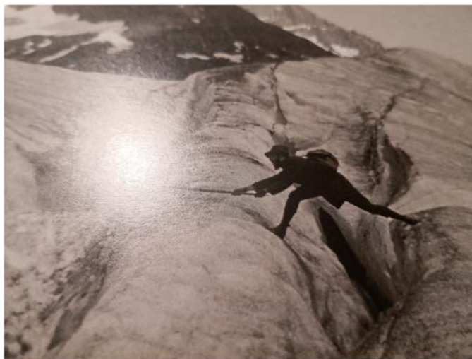
Isabelle GIOVACCHINI Les Alpes fantastiques , (détail) 2020 Collection Frac Occitanie Montpellier

[Léa Bismuth, Le Quotidien de l'art , mercredi 12 mai 2021 (extrait).]