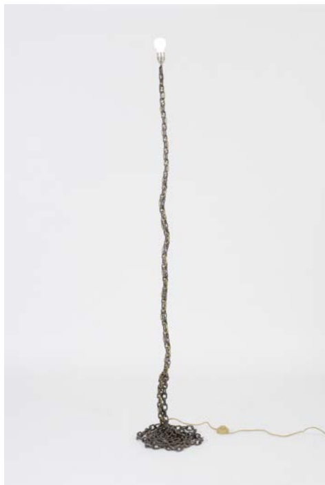
Franz WEST Privatlampe des Künstlers II , 1989 Collection Frac Occitanie Montpellier

Franz West compte parmi les artistes actuels les plus importants en Autriche. Il s'est fait connaître principalement pour ses œuvres tridimensionnelles (sculptures en plastique, œuvres in situ, installations dans des salles d'exposition). Il est aussi le créateur de performances, de graphismes et d'affiches.