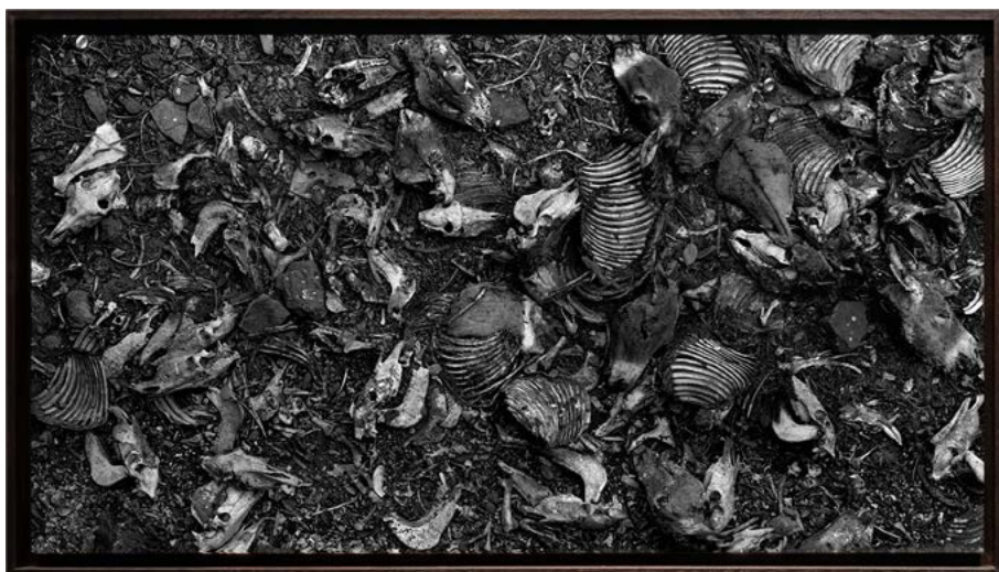
04 Yo-Yo GONTHIER Des ânes et des lions , 2007 Sous-titre : Bamako, Mali de la série « Les vivants » Collection Frac Occitanie Montpellier