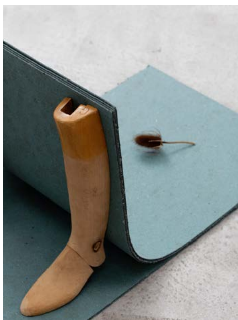
Guillaume CONSTANTIN Sometimes I Walk, Sometimes I Kneel Collection Frac Occitanie Montpellier

[Extrait du dossier pédagogique réalisé par la Maison des arts Georges & Claude Pompidou, Cajarc, 2020.]