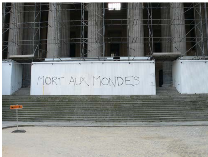
Samuel BUCKMAN Mort aux mondes , 2008 / 2018 Collection Frac Occitanie Montpellier.

Samuel Buckman inspire le monde et offre son souffle en retour, un souffle qui aide à respirer mieux. Il se laisse traverser par les objets, les rebuts, les petits riens, l'animal, le végétal, les livres ou les êtres humains. Ainsi naissent ses œuvres, protéiformes, dans la fraîcheur du quotidien. Pendant deux ans, il a d'ailleurs creusé cette question du travail de l'artiste au quotidien, en publiant un dessin par jour.