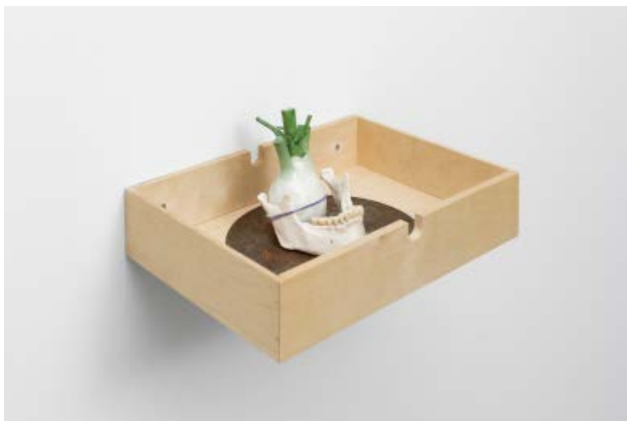
O2 Guillaume CONSTANTIN Pushing My Face in The Memory Of You Again 2018, céramique réalisée par Marion Auburtin Collection Frac Occitanie Montpellier