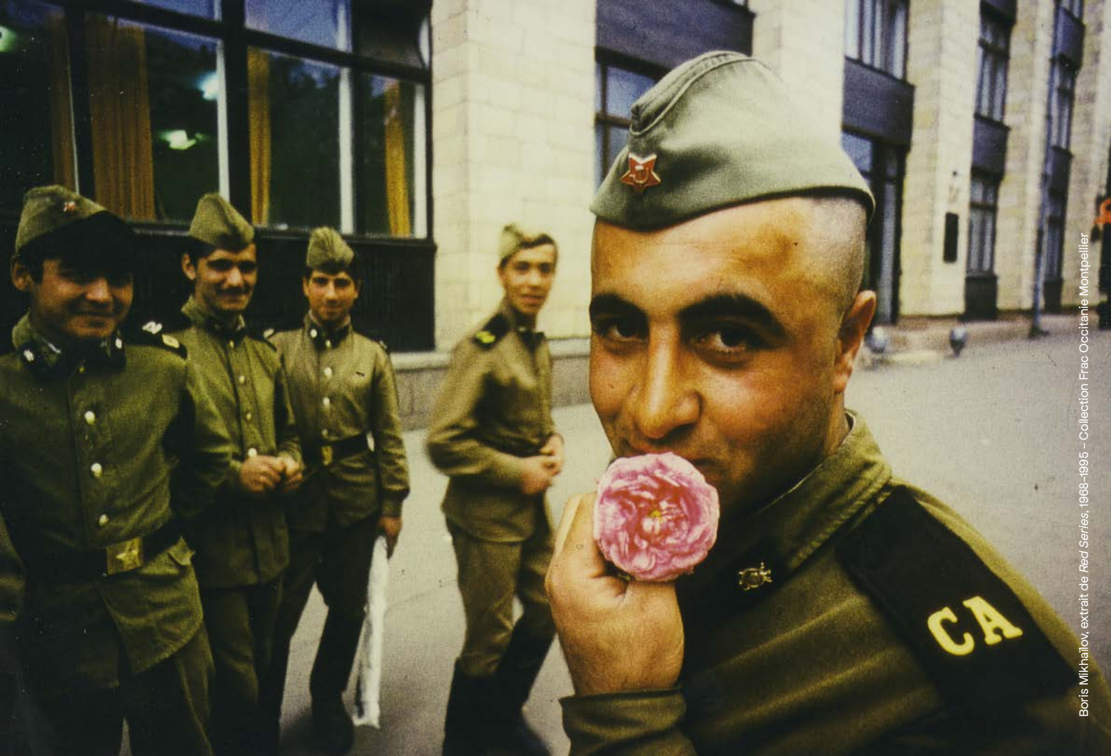
Boris Mikhalov, extrait de Red Series, 1968-1995 - Collection Frac Occitanie Montpellier