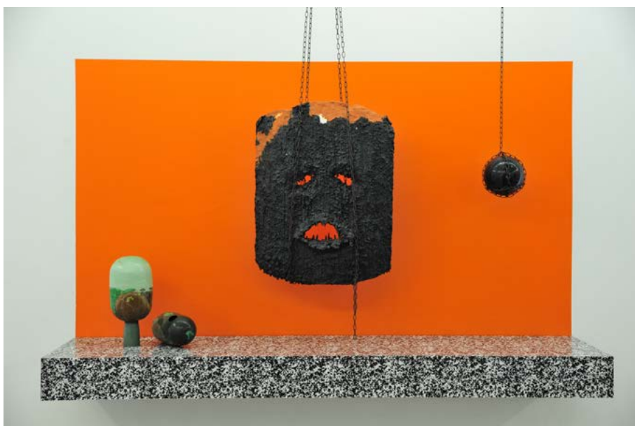
03 Laura GOZLAN The Sceptical Chymist , 2013 Collection Frac Occitanie Montpellier

Télécharger les 4 VISUELS PRESSE : https://we.tl/t-WtnzgdTAQh