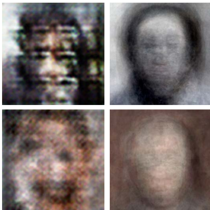
Julien PRÉVIEUX Les inconnus connus inconnus #2, #3, #6 et #8, 2018. Collection Frac Occitanie Montpellier

Julien Prévieux s'est fait connaître avec ses Lettres de non-motivation, qu'il a adressées pendant plusieurs années à des employeurs en réponse à des annonces consultées dans la presse, détaillant les motivations qui le poussaient à ne pas postuler. En recourant à des formes d'expressions variées, de l'installation à la performance, il interroge les rationalités technologiques et économiques contemporaines dans leurs effets et leur emprise sur les corps individuels et collectifs.