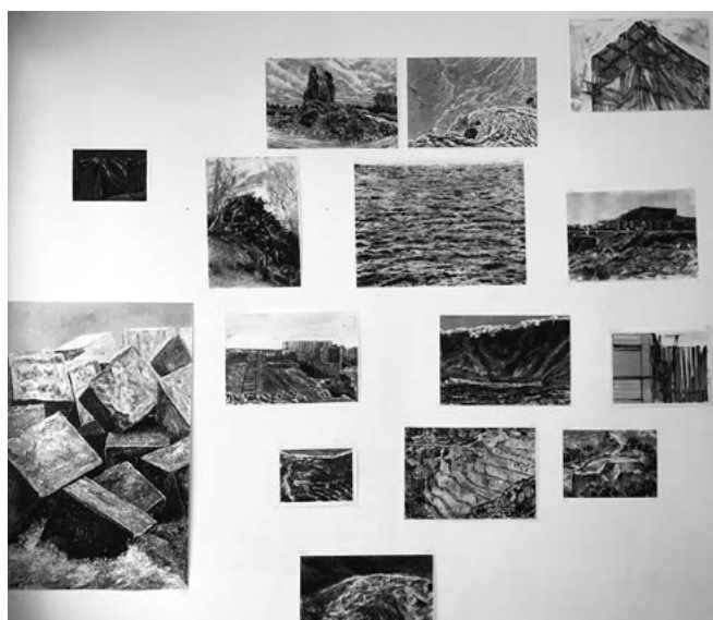
Nathalie WETZEL Mise à jour , 2019 Collection Frac Occitanie Montpellier