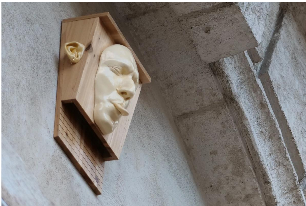
— Geoffrey Badel, Panser l'étrange , 2022, sculpture, nichoir à chauve-souris en pin, moulages en plâtre vernis, boucles d'oreille, 34 x 20 x 12 cm « Comme un écho tonne », Frac Occitanie Montpellier.

2023 – 67e édition du Salon de Montrouge, Commissariat Guillaume Désanges et Coline Davenne , Beffroi de Montrouge