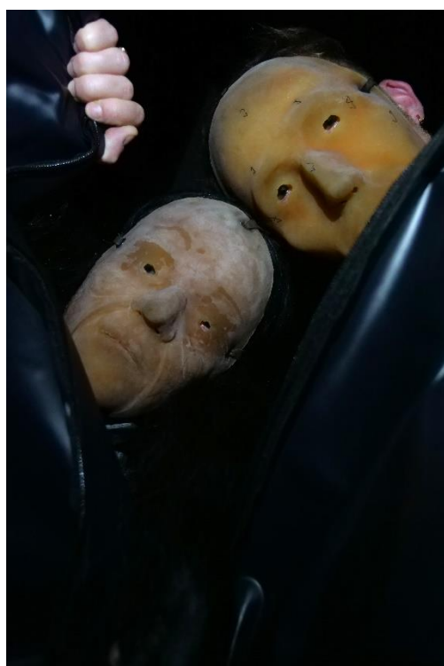
— The Manila Room . © Ziti et Orzo (Chloé Viton et Geoffrey Badel) – Frac Occitanie Montpellier, Centre Culturel Universitaire Paul-Valéry et La Vignette 2023

TÉLÉCHARGER LES VISUELS PRESSE : https://we.tl/t-bWDlctlcne