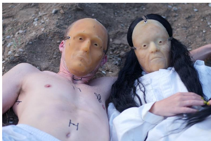
— What are you looking at? © Ziti et Orzo (Chloé Viton et Geoffrey Badel) – Frac Occitanie Montpellier, Centre Culturel Universitaire Paul-Valéry et La Vignette 2023