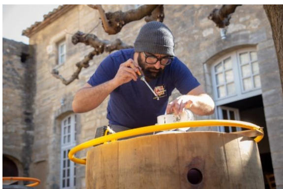
Résidence à la Chartreuse – J-A Arzilier

Le projet « Mastic » rassemble des œuvres spécialement conçues par Jean-Adrien Arzilier pour ces lieux. Le volet de la résidence comprend un temps d'intervention avec les élèves hors et dans les murs du lycée. Parallèlement, à la Chartreuse, l'artiste produira des œuvres qui seront présentées dans les lieux partenaires.