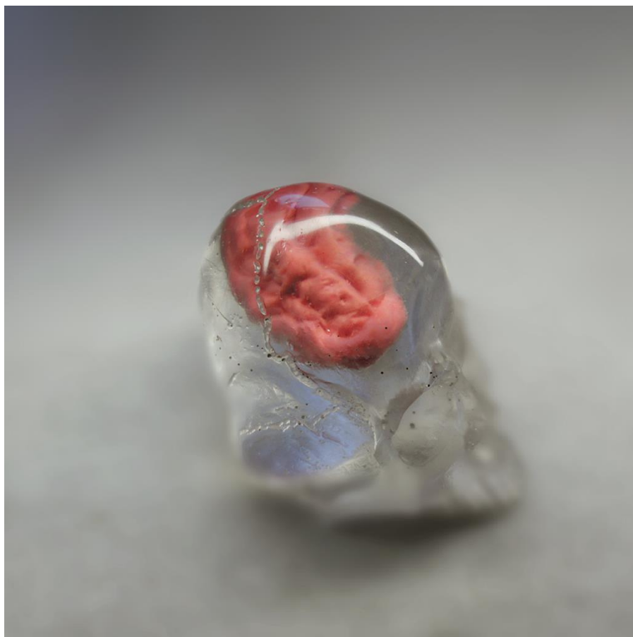
Des Testes - 2019, résine et pâte à mâcher 10 x 6 x 7 cm