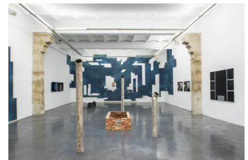
Vue de l'exposition Temps d'un espace-nuit Frac Occitanie Montpellier, 2018