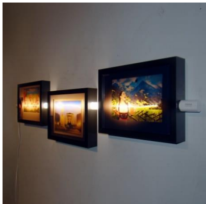
Dessins au flash

2019 - Installation de série de photographies au flash de cartes postales lenticulaires Technique mixte - Environ 120 x 40 cm - Production en résidence Villeneuve lez Avignon