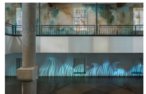
Vue de l'exposition Courant Continu Moulin des Évêques, Agde, 2018