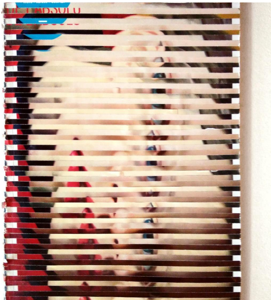
Bbbeettttttyy - 2013 - collage de magazines - 21 x 76 x 0,6 cm - Collection de l'artiste

Le FRAC Occitanie Montpellier pilote le réseau ACLR/ Art contemporain en Languedoc-Roussillon .