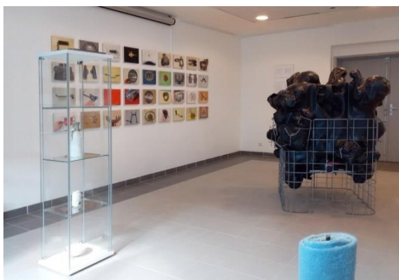
Exposition Reserve and Reverse au lycée Jean-Vilar, Villeneuve lez Avignon – Collection Frac OM- 2018

Leurs œuvres re-présentent, dans le sens de présenter à nouveau, des objets ou des valeurs d'objets de notre monde de production post industrielle, étudiées, relues, détournées. Menées par des artistes de différents horizons, développées sur différents médiums, ces études, définissent un point de vue distancié sur notre monde de surproduction, utilisant cette distance d'étude que l'on pourrait prêter de scientifique. C'est d'ailleurs pour cela que l'exposition se présente quasiment telle une présentation de recherche archéologique et ethnographique. Cependant n'est pas présenté ici qu'un catalogue des objets de notre temps, les artistes regroupés ici y affirment leur pouvoir de sorciers. Initiant une retenue d'attention, puis une lecture à rebours, ils réenchangent dans ce qu'ils ont d'arides les objets utilitaires en démontant et réordonnant leur système de valeur : le pratique cède au plastique, le commun au mystère, l'usage au muséal. » Jean-Adrien Arzilier