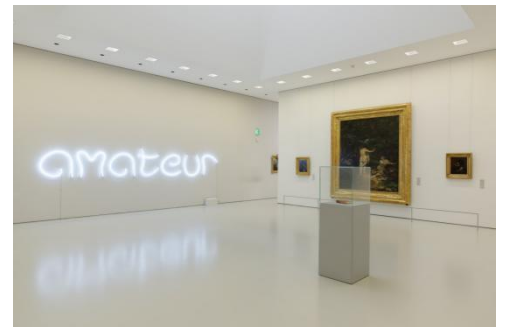
Exposition Le rêve de la fileuse Musée Fabre Montpellier