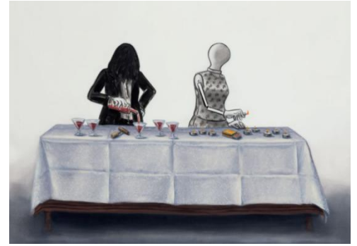
Lisa Milroy, Tablecloth , 2016. Collection FRAC OM ©Lisa Milroy

Il travaille en étroite collaboration avec la Direction régionale des affaires culturelles, la Région, le Rectorat et le Conseil départemental. Des conférences et des rencontres sont organisées avec les artistes. Au Frac, un vaste programme d'activités, visites, rencontres est proposé au public tout au long de l'année en écho aux expositions.